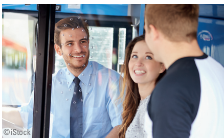
Einfache Integration und Verwendung