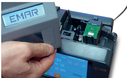
TWN4 MultiTech Mini Reader im Kassensystem „EMAR 205“ mit der Möglichkeit zur Verarbeitung elektronischer RFID-Tickets.

Der Elatec TWN4 MultiTech HF Mini Reader deckt alle Anforderungen von EMAR ab. Weitere Informationen: www.elatec-rfid.com/case-studies/