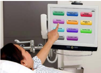
Multimedia-Terminal in der Klinik – Abrechnung über kontaktloses Bezahlen

RFID-Systeme sind in Kliniken bereits weit verbreitet, etwa bei der Zutrittskontrolle. Auch während der Visite und zu Dokumentationszwecken wird die kontaktlose Identifikation eingesetzt. Hier spielt die Kostenreduktion oft eine wichtige Rolle. Ein weiterer und nicht zu vernachlässigender Aspekt ist der Einsatz von RFID, um den Klinikaufenthalt für Patienten möglichst angenehm zu machen.